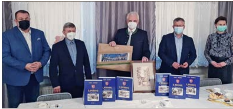
Das Autorentreffen im DFK-Tworkau