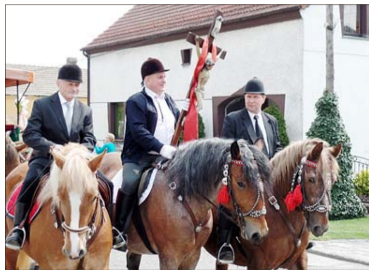
Die Osterreiten-Prozession wird von Reitern mit einem Kreuz angeführt.

Mit dem Osterreiten soll die frohe Botschaft von der Auferstehung Christi verkündigt werden. Dabei sind nicht nur die Reiter schick angezogen, auch die Pferde werden festlich geschmückt. Das Pferdegeschirr ist aufwendig geziert, dazu gibt es blau oder rot umrandete