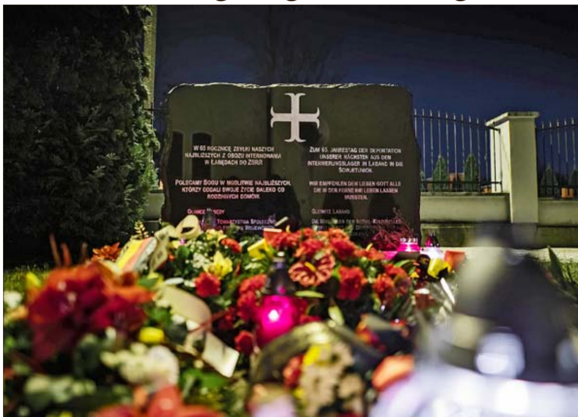
Das Denkmal in Laband, das den Opfern der Internierungen und Deportationen gewidmet ist.

Den Anfang machte eine in vielen Städten der Region ausgehängte Bekanntmachung, in der die Männer auf-